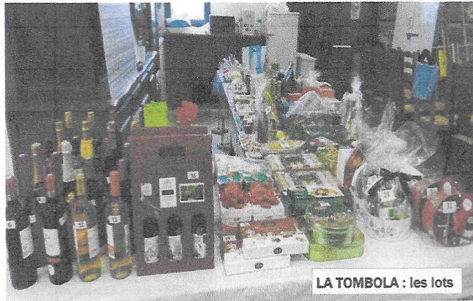
LA TOMBOLA : les lots

En ce samedi 20 décembre 2025, dès 13h30, la salle s'est animée d'un joyeux brouhaha : soixante douze adhérents, sourire aux lèvres et bonne humeur en bandoulière se pressaient pour enregistrer leur pari à la fameuse tombola, véritable rituel d'ouverture de notre fête de Noël.