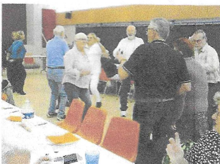
Les danseuses et danseurs