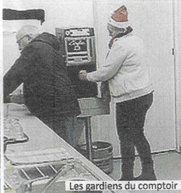
Les gardiens du comptoir