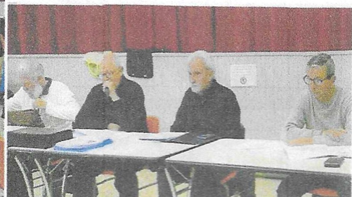
Le Conseil d'Administration